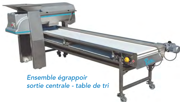
Ensemble égrappoir sortie centrale - table de tri