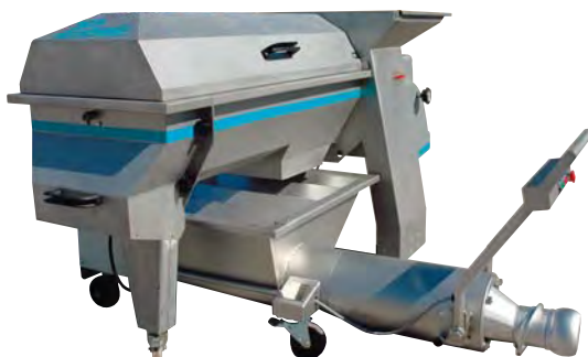
Ensemble égrappoir pompe à vendange